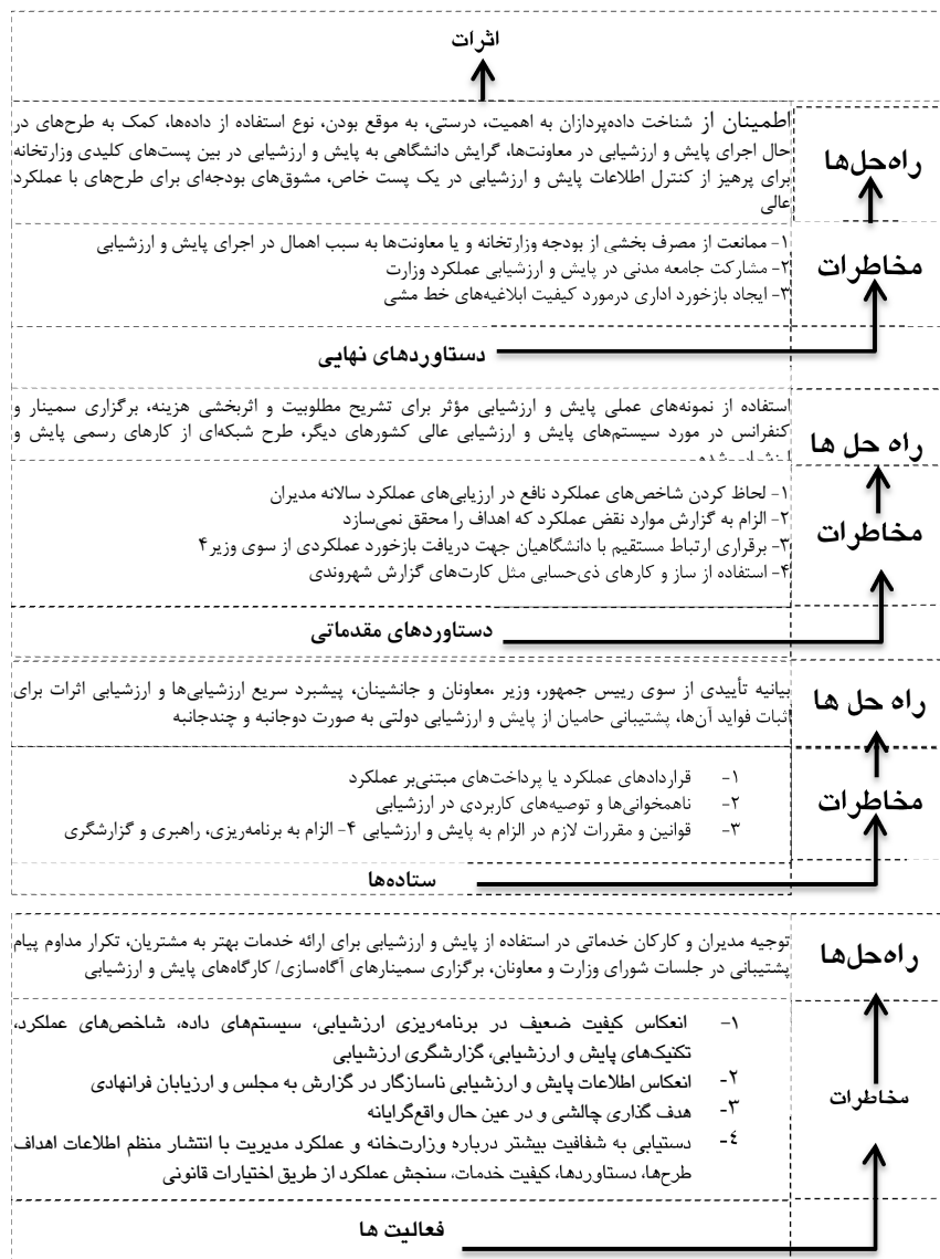
جدول ۴ مدل چارچوب منطقی شرطی زنجیره نتایج مدل پایش و ارزشیابی خطمشی‌های وزارت علوم